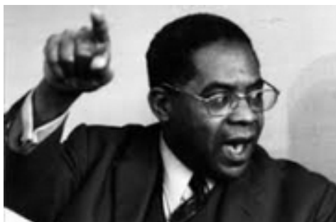
Aimé Césaire (1913-2008)

Influencé par le surréalisme, il mêle métaphores audacieuses et expression de la révolte.